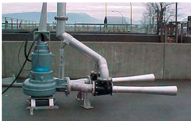
ITT Flygt a offert trois FgN 217-74 pour évaluation.

Après quatre années de fonctionnement, la station a économisé des centaines de milliers de dollars en coûts de fonctionnement et a évité une modification coûteuse pour se conformer aux exigences de capacité et de réglementation.