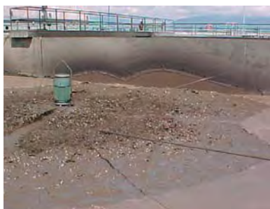
À remarquer la hauteur libre. Les bas niveaux avaient pour but de contenir les éclaboussures créées par les aérateurs de surface, ce qui ne fonctionnait pas toujours.

Naissant dans les Rocheuses de la Colombie-Britannique, le magnifique fleuve Fraser se jette dans l'océan Pacifique. Peu avant d'atteindre Vancouver, il traverse le canton de Langley, où se trouve la Langley WWTP, une station secondaire d'épuration des eaux exploitée par le District régional de Vancouver (DRV) qui traite en moyenne neuf millions de litres d'eaux usées par jour produits par une population de 28 000 personnes.