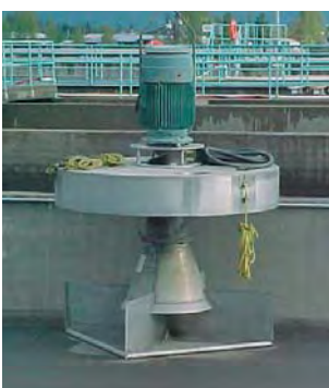
Un des aérateurs de surface retiré du premier digesteur.

de surface, ce qui suscitait des préoccupations évidentes pour la santé. Par temps froid, les aérateurs étaient désactivés en raison du givrage.