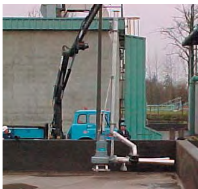
Descente des unités dans le digesteur.